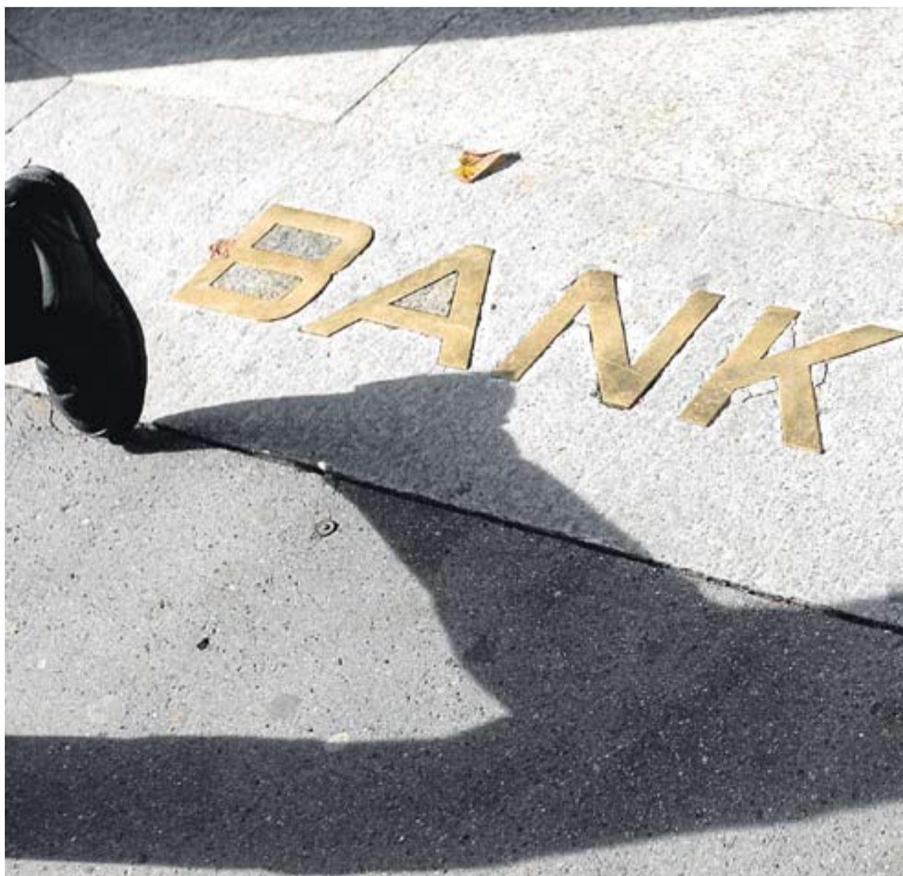
Entrada de un banco en Zurich, la capital financiera de Suiza.

cieros, un acuerdo que podría permitirle abandonar el grupo estadounidense. El acuerdo permitiría además a Saab salir de la suspensión de pagos.